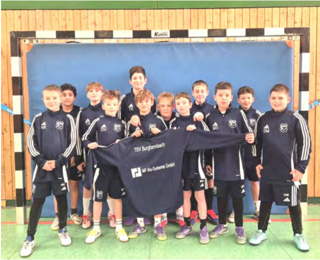
Von MF Alu-Systeme - Zipperjacken für unsere D2