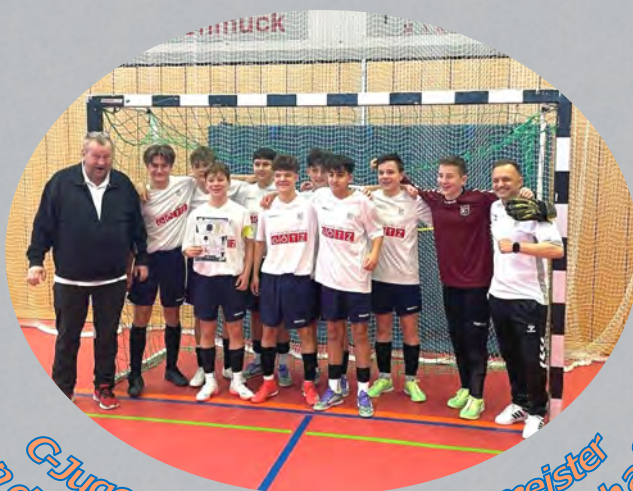
C-Jugend-Vize-Hallenkreismeister und Teilnehmer Bezirksmeisterschaft