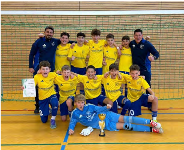
D-Jugend Fürther Stadtmeister 2026

... als auch auf organisatorischer Ebene können wir durchaus zufrieden sein: