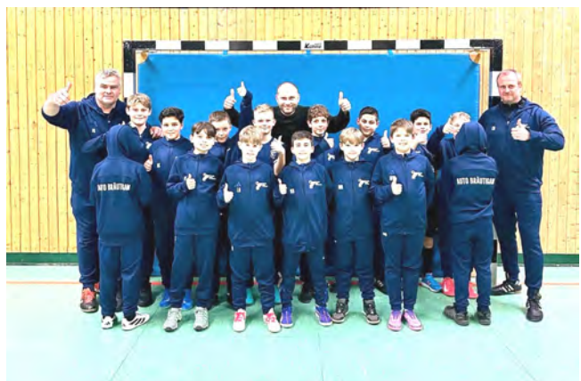
Von Auto Bräutigam Ausgehanzüge für unsere E1_E2