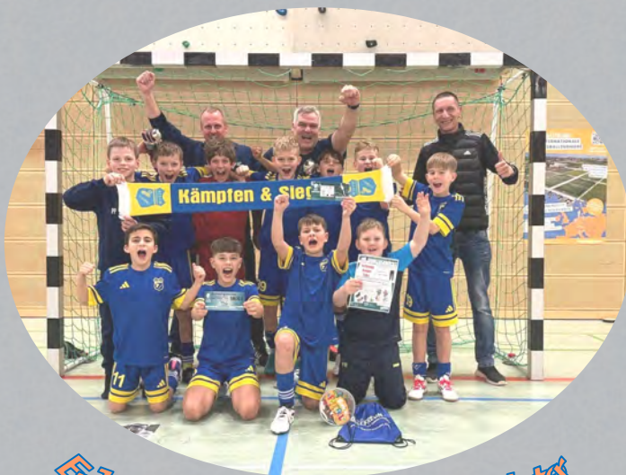
E-Jugend-Hallenkreismeister Nürnberg-Frankenhöhe 2026