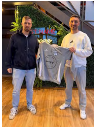
1. Mannschaft neue Hoodies von Hungry Food & Drink und Putzkartell

Außerdem wurden wieder zahlreiche Mannschaften mit diversen neuen Klamotten ausgestattet. Hier geht ein großer Dank an die Sponsoren, meist selbst aus der Stadt oder der Region, die ein Auge für den lokalen (Nachwuchs-)Fußball beweisen und uns solche Anschaffungen überhaupt ermöglichen!