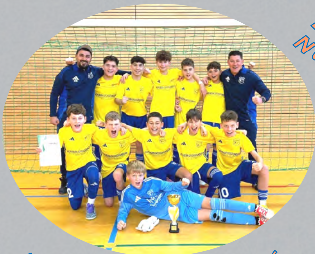
D-Jugend Fürther Stadtmeister 2026