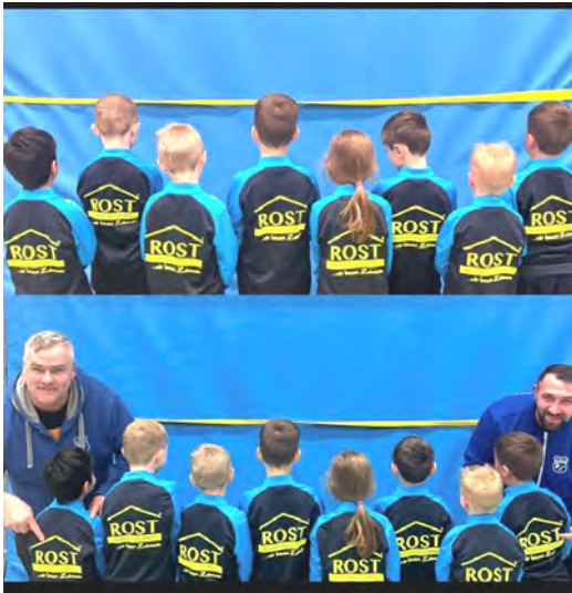
Wohnbau Rost spendierte Trainingsanzüge für unsere G1