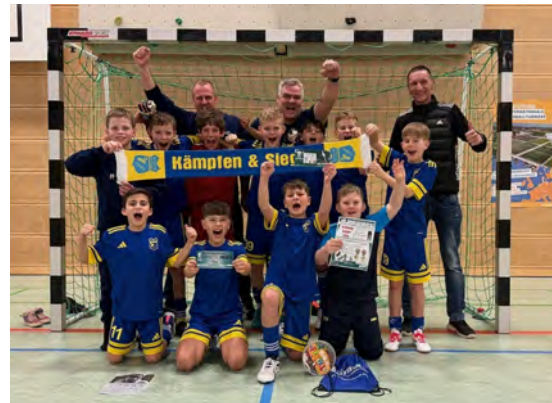
E-Jugend-Hallenkreismeister Nürnberg_Frankenhöhe 2026

Auch unsere E-Jugend war nicht zu bremsen: Vorrunde in Schopfloch, Zwischenrunde in Wassertrüdingen, Endrunde in Burgbernheim – der Verband hat uns einmal quer durch den Spielkreis gejagt, doch das hinderte uns nicht daran, Hallenkreismeister 2026 zu werden! Zahlreiche Hochkaräter wie Mögeldorf, SGV Nürnberg, Quelle Fürth usw. hinter uns gelassen – Glückwunsch zu diesem Riesenerfolg für unseren Verein!!