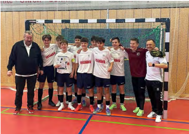
C-Jugend-Vize-Hallenkreismeister und Teilnehmer Bezirksmeisterschaft

Unsere C-Jugend legte bei der Hallenkreismeisterschaft einen so nicht abzusehenden Lauf hin: Vorrundenturnier gewonnen, im Finalturnier Zweiter hinter der SpVgg Mögeldorf und somit die Qualifikation für die Bezirks-Endrunde, wo wir uns mit einigen hochdekorierten NLZ- und Bayernliga-Teams messen durften!